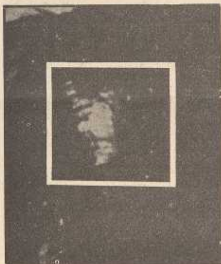
Sotto: larva a figura di volto di satiro visibile sul riquadro, tra i capelli, girando a sinistra la pagina.