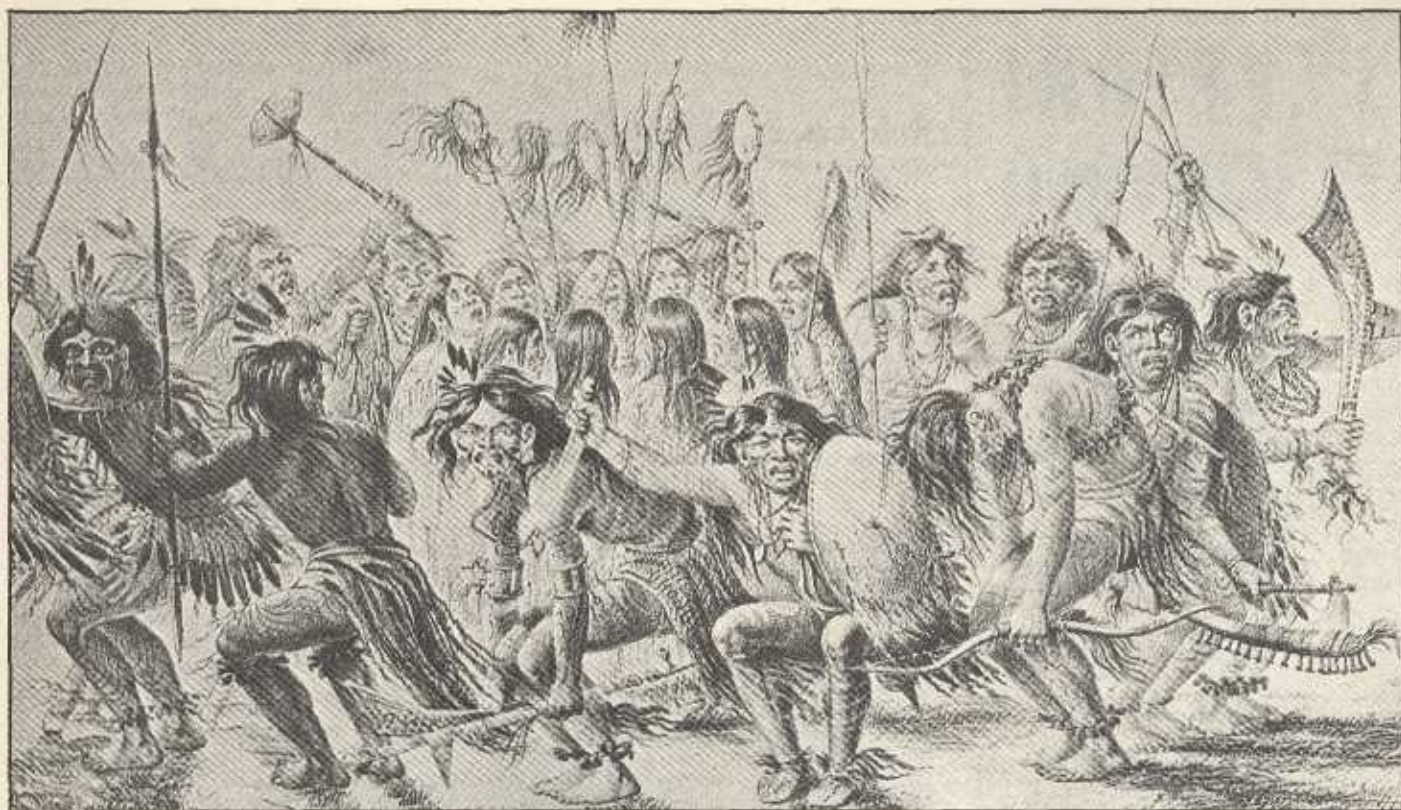
Nelle società primitive, la danza è uno dei metodi per procurarsi uno stato di «trance» o per essere posseduti dal dio. Nell'illustrazione, la danza dello scalpo presso una tribù indiana nordamericana.

di ogni tipo, a creare uno stato di completa apatia e di ripudio di ogni contatto vitale: farlo divenire cioè una specie di larva vegetante.