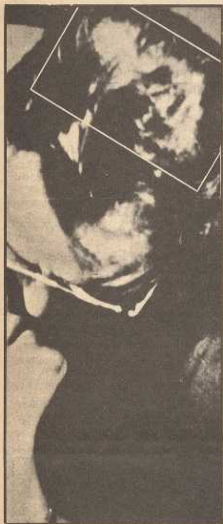
Larva, a figura di volto, nei capelli.

nenti alle quattro forze elementari, i quali penetrando nel guscio si fondono in esse creando un terzo essere autonomo, con una propria individualità e capacità volitiva, con una vita mortale, e quindi con la necessità di nutrirsi continuamente di energie.