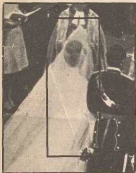
Qui, a destra, la foto del matrimonio di Anna d'Inghilterra tratta da « Oggi Illustrato » del 29-11-'73; sopra, nel riquadro, il particolare della stessa foto in cui appare chiaramente la figura (larva?) di una donna.