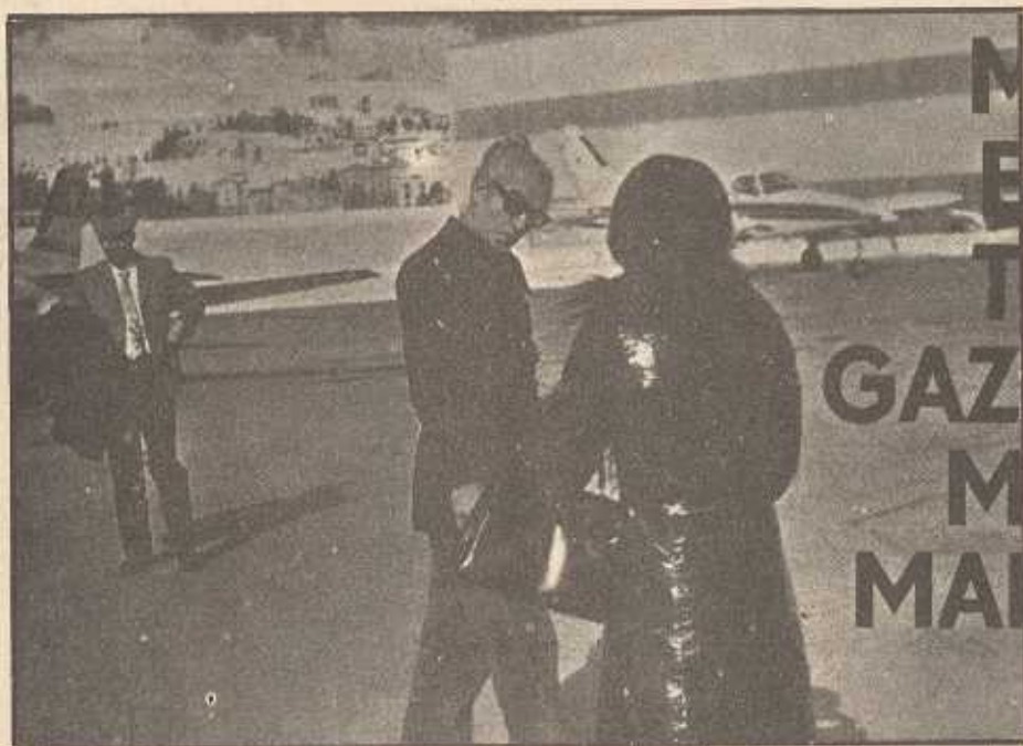
Sopra, foto tratta da un rotocalco in cui si vede Reza Pahlevi con la figlia Shanaz (di spalle). Nel particolare accanto è visibile, nel riflesso del soprabito di Shanaz, un volto umano.