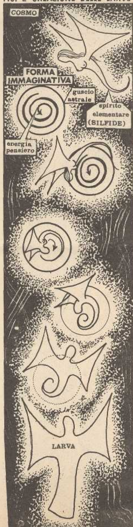
FIG. 2 CREAZIONE DELLE LARVE

su chi procede verso una vita senza scrupoli, una vita esagitata e disarmonica, sui mistici esaltati, sulle persone convulsamente tese verso mete incontrollate, ecc.