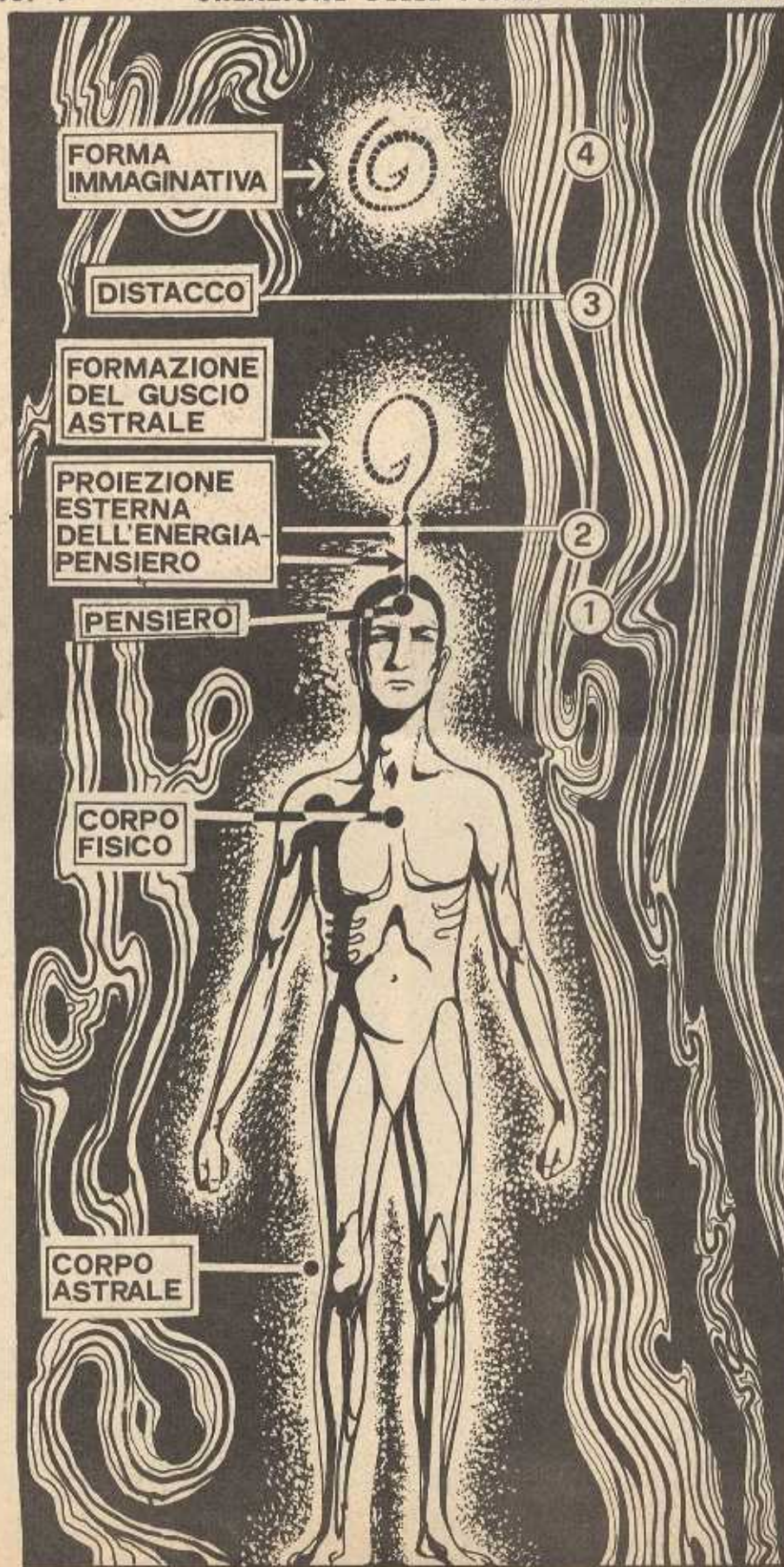
FIG. 1 CREAZIONE DELLE FORME-IMMAGINATIVE

Fig. 1 - L'essere vivente pensa. Il pensiero si trasforma in impulso energetico. L'impulso viene proiettato all'esterno, passando così dal corpo fisico a quello eterico rivestendosi di sostanza astrale, come l'aria nel sapone, formando un guscio, una bollicina siderale che si libra nel cosmo. Pertanto le forme-immaginative sono cariche energetiche con un involucro astrale, ognuna con una « carica pensante » fissa, non soggetta a trasformazioni di per se, cioè fissa nella sua « caratteristica forma-pensiero » con la quale è nata.